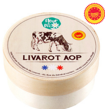
Livarot AOP LP 250g - PCB 6