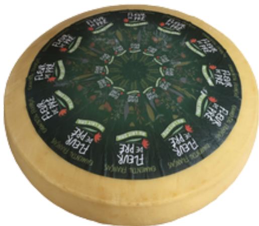
Emmental LC meule 80kg - PCB 1