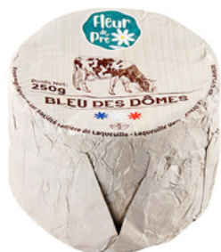
Bleu des Dômes LP