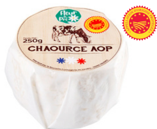
Chaource AOP LT - PCB 6