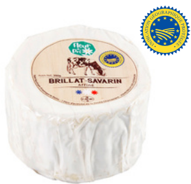
Brillat-Savarin affiné IGP LP