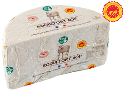
Roquefort AOP LC 1/2 Pain 1,35kg - PCB 4