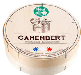
Camembert moulé à la main LP 250g - PCB 12