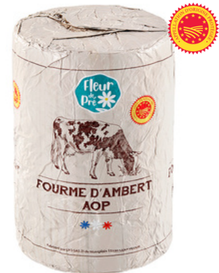
Fourme d'Ambert AOP LP 2,35kg - PCB 2