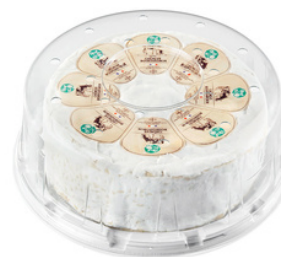
Crèmeux Bourguignon LP 1,6kg - PCB 1