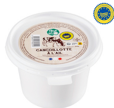
Cancoillotte ail IGP