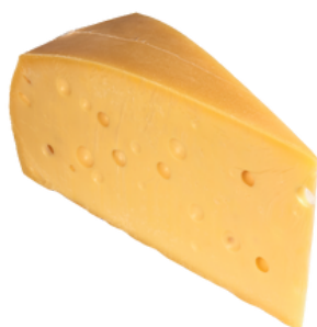
Emmental LC 1/8 10kg - PCB 2