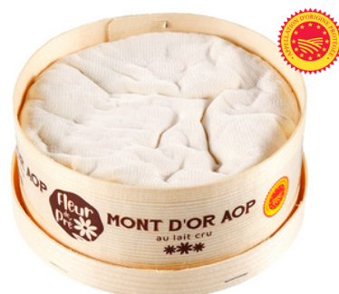
Mont d'Or AOP LC