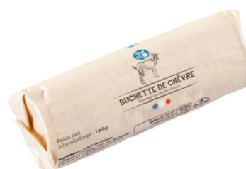
Buchette de chèvre LP 180g - PCB 15