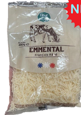
Emmental Français Râpé