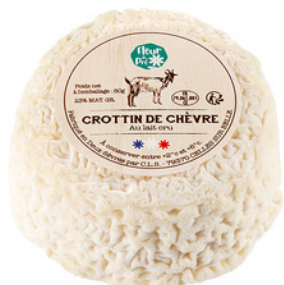
Crottin LC 60g - PCB 12