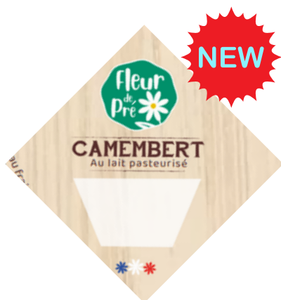
Camembert LP mini-portion 30g - PCB 12x8 portions de 30g