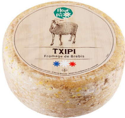
Txipi Pur Brebis LP 4,6kg - PCB 2