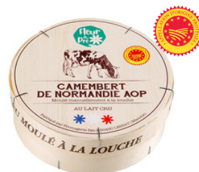
Camembert de Normandie AOP LC 250g - PCB 12