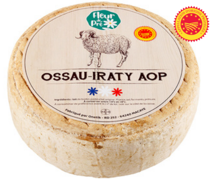
Ossau-Iraty AOP LP 4,3kg - PCB 2