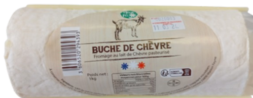
Buche de chèvre LP 1kg - PCB 1