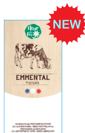
Emmental français LP portion 250g - PCB 40