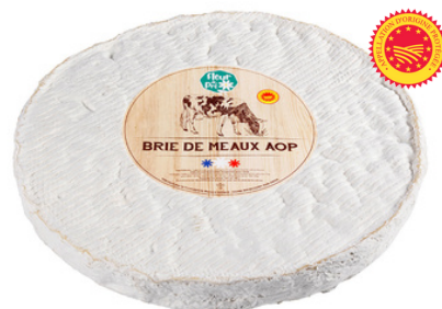
Brie de Meaux AOP LC 3kg - PCB 1

Switch vers le nouveau packaging prévu en Septembre