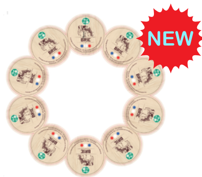
Brie LP 3,3kg - PCB 1