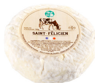
Saint-Félicien LT 150g - PCB 9