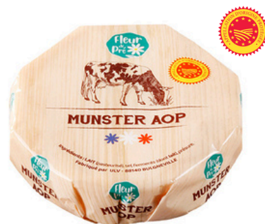
Munster AOP LP