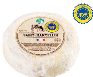
Saint-Marcellin IGP LT 80g - PCB 16