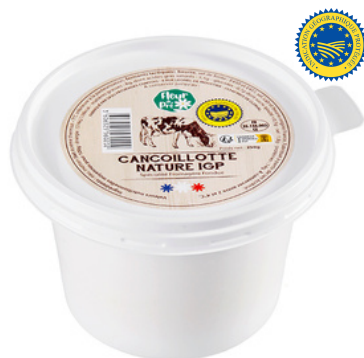
Cancoillotte nature IGP