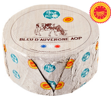
Bleu d'Auvergne AOP LP