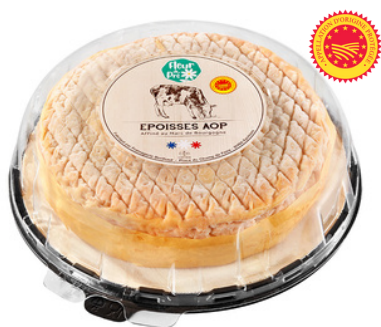
Epoisses AOP LP