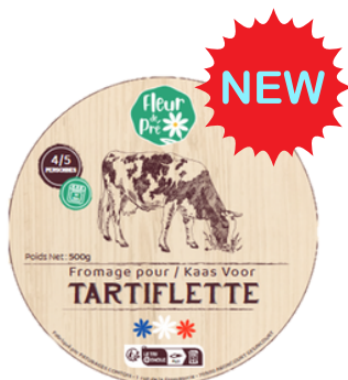
Fromage à tartiflette LP 500g - PCB 6