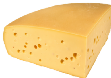
Emmental LC 1/4 20kg - PCB 1