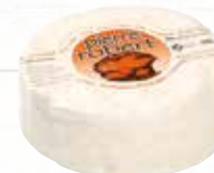
180325 PIERRE ROBERT 39% LC NU 500G ROUZ