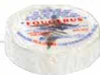
FOUGERUS 20% LC ROUZAIRE