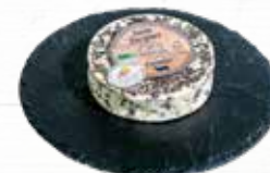
ST JACQUES BIO 27% LP 220G TREMBLAYE