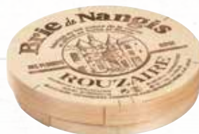
555013 BRIE NANGIS 20% LC 1K ROUZAI